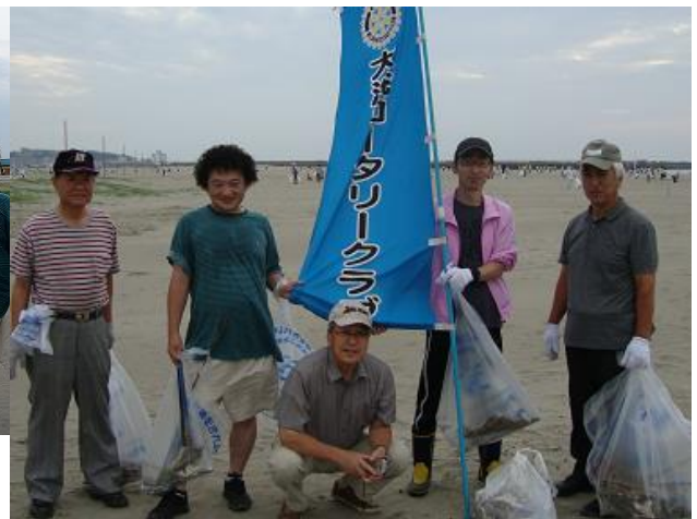
7月3日(日) 6:00 大洗サンビーチ