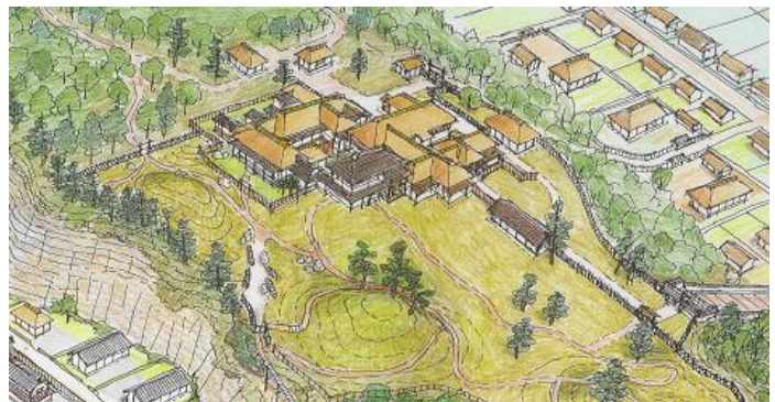
貧賓閣(湊御殿)復元スケッチ(講演会から)