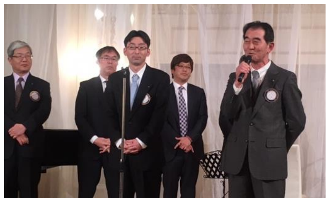
次期大山会長及び加部東幹事の紹介