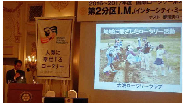
発表する大山副会長