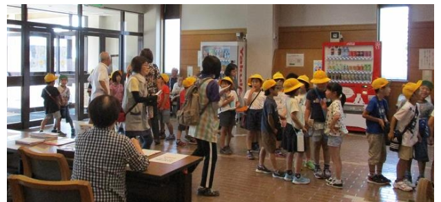
地元小学校の皆さん