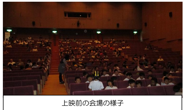
上映前の会場の様子