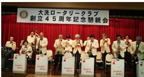
『ソウルフル・ユニティ』の演奏