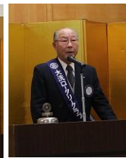
記念事業報告 田山記念事業委員長